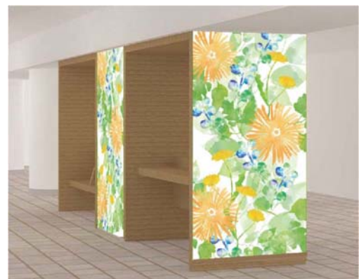
「カプセルベンチ」イメージ（別紙参照）