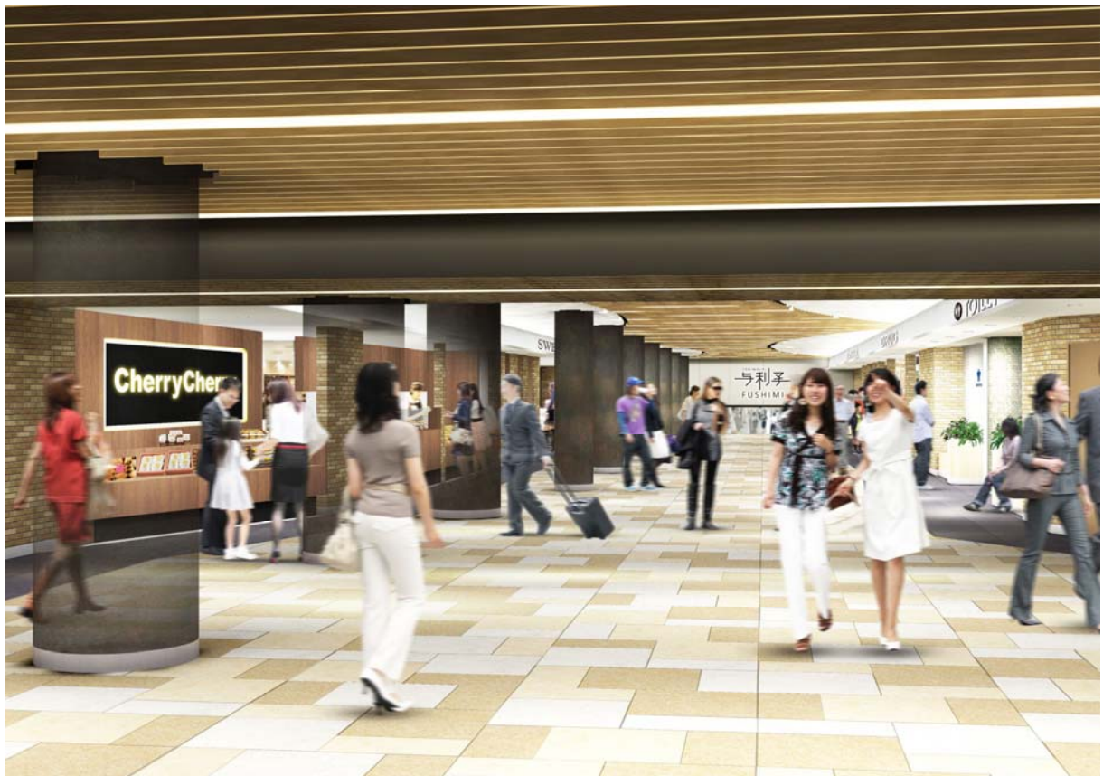
ヨリマチFUSHIMIイメージパース