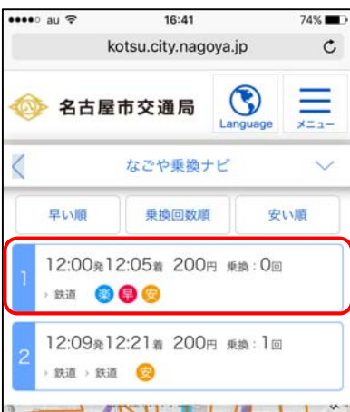
検索結果ルート1をタップ