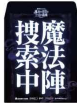
謎解きキット： クリアファイルバッグ

(注)乗車券のみや謎解きに必要な冊子などセット内容の一部のみの販売はありません。